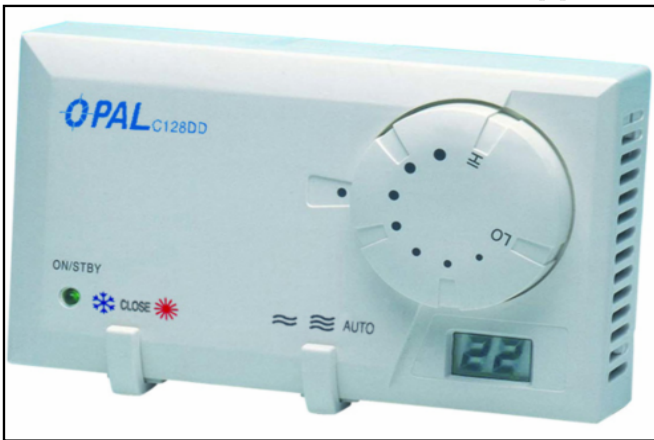
ADAD ( Opal c-128 dd )