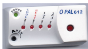
Устройство приема сигналов C-612 D