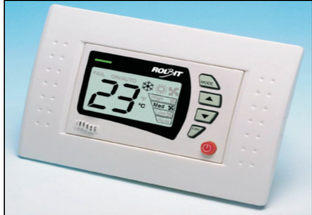
ADAD LCD ( Opal c-650 dd )